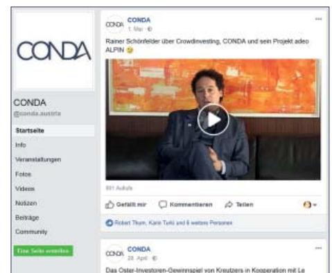
COOEE alpin Hotels