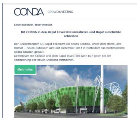
Newsletter Rapid InvestOR